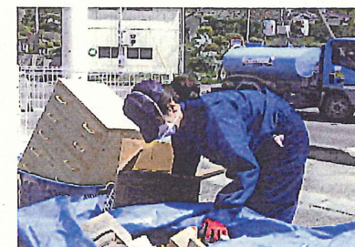
清掃・片づけ作業